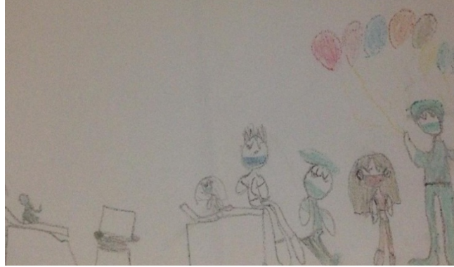
Figura 1. Dibujo realizado por el participante Na1.

A seguir como se mencionó anteriormente, se colocan algunos ejemplos de los dibujos que utilizaron los participantes para contar sus narrativas de acuerdo a la pregunta realizada. Pueden observarse en las imágenes como los niños se centraron en lo que dibujaron para desarrollar sus discursos, en estos casos se ilustran Na1, No4, No5.