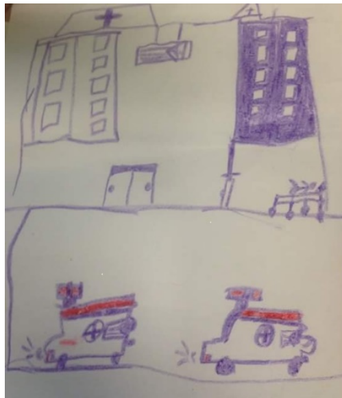
Figura 2. Dibujo realizado por el participante No4